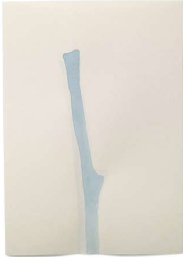
2010 | Tinte auf Papier | 14,8 x 21 cm