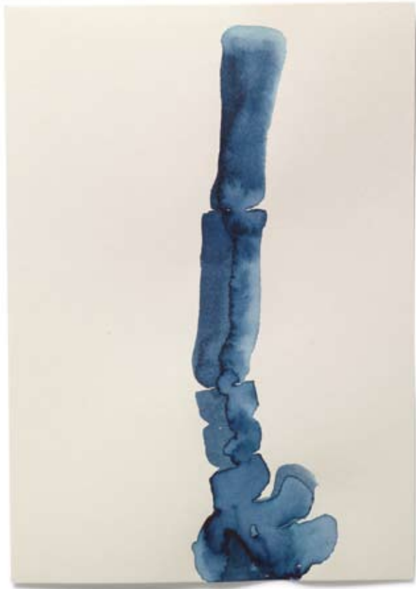
2010 | Tinte auf Papier | 14,8 x 21 cm