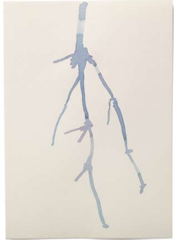
2010 | Tinte auf Papier | 14,8 x 21 cm