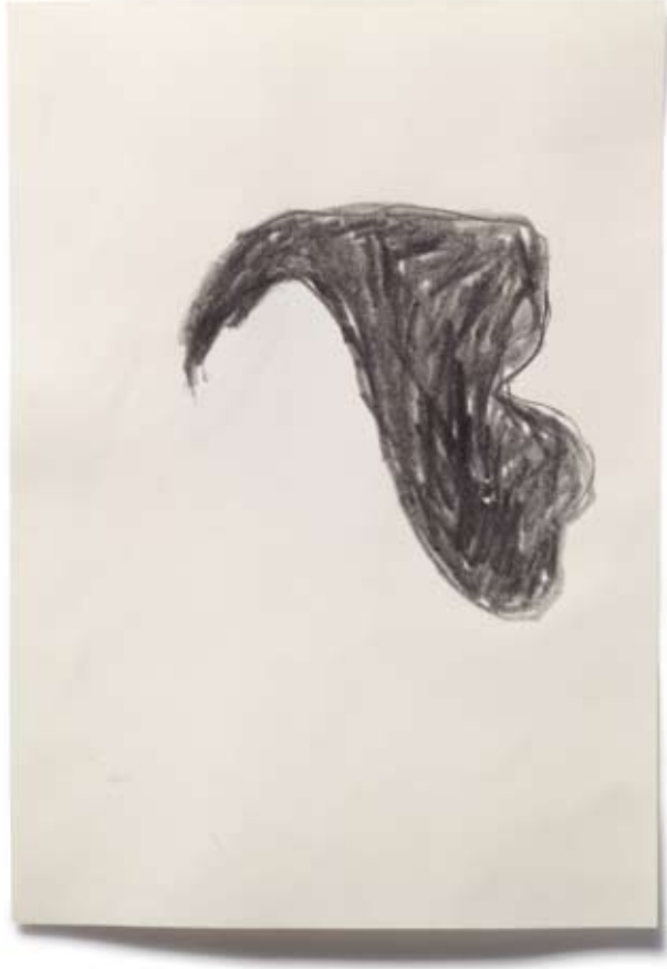
2010 | Bleistift auf Papier | 14,8 x 21 cm