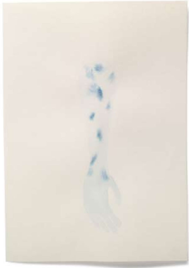
2010 | Tinte auf Papier | 14,8 x 21 cm