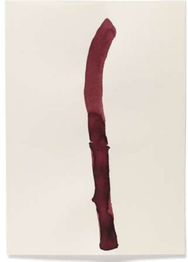
2010 | Tinte auf Papier | 14,8 x 21 cm