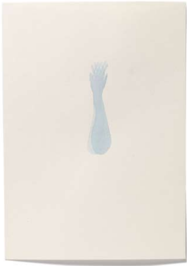
2010 | Tinte auf Papier | 14,8 x 21 cm