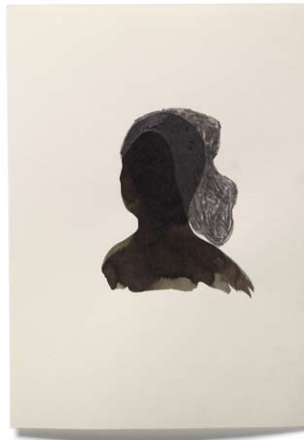
2010 | Tinte und Bleistift auf Papier | 14,8 x 21 cm (nach: Portrait Jeanne de Laval von Nicolas Froment, ca. 1476)