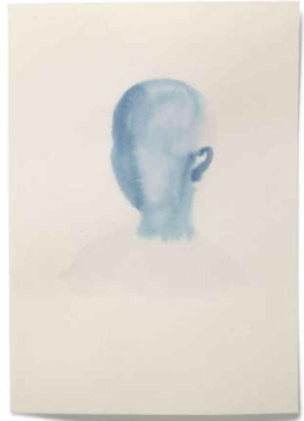
2010 | Tinte auf Papier | 14,8 x 21 cm