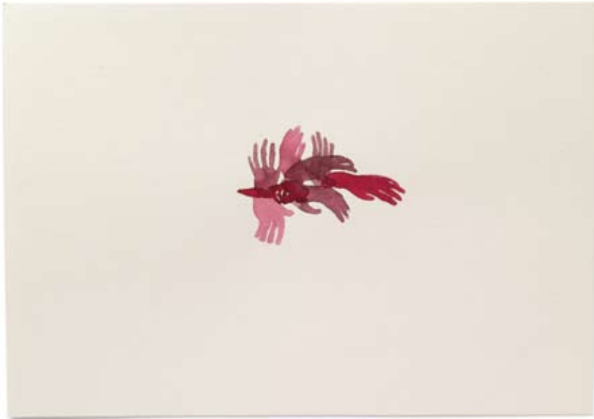
2010 | Tinte auf Papier | 14,8 x 21 cm (nach: Das letzte Abendmahl, Leonardo da Vinci, 1498)