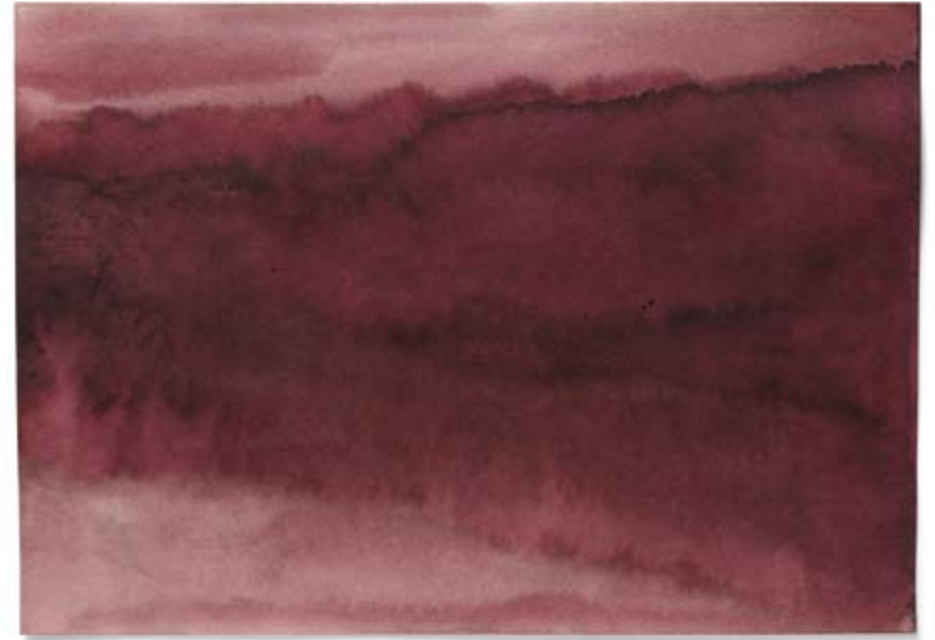
2010 | Tinte auf Papier | 14,8 x 21 cm