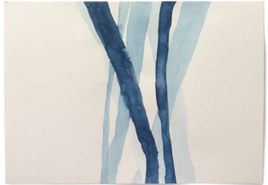
2010 | Tinte auf Papier | 14,8 x 21 cm